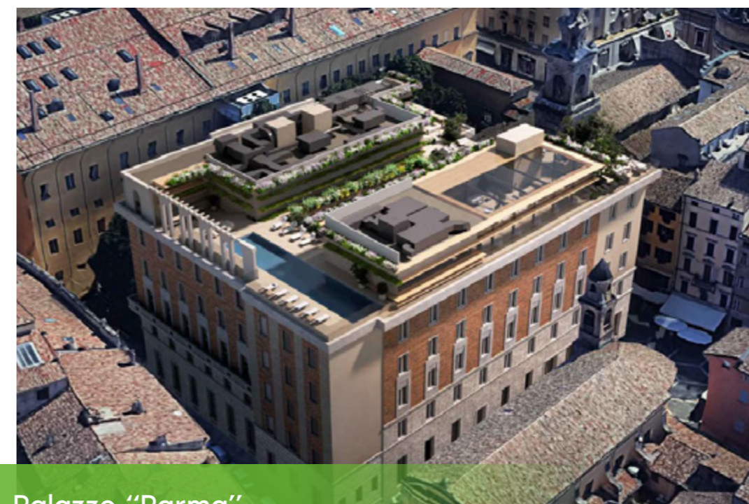
Palazzo "Parma" Parma

Gestione commessa Impianti Meccanici e HVAC recupero edilizio Ex Ospedale San't Agostino - MO con gestione progetto BIM (€ 7.108.947 in corso)