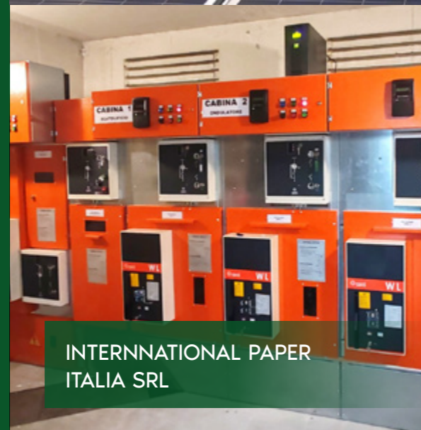
INTERNATIONAL PAPER ITALIA SRL