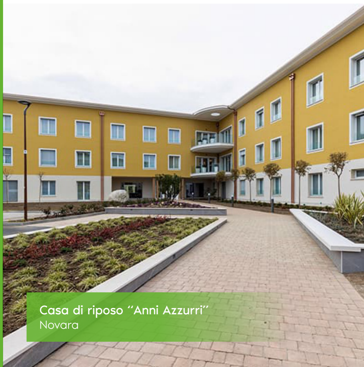
Casa di riposo "Anni Azzurri" Novara

Dalla gestione delle commesse al supporto in cantiere, passando per la modellazione BIM e il controllo qualità, garantiamo un approccio preciso, integrato e orientato ai risultati.