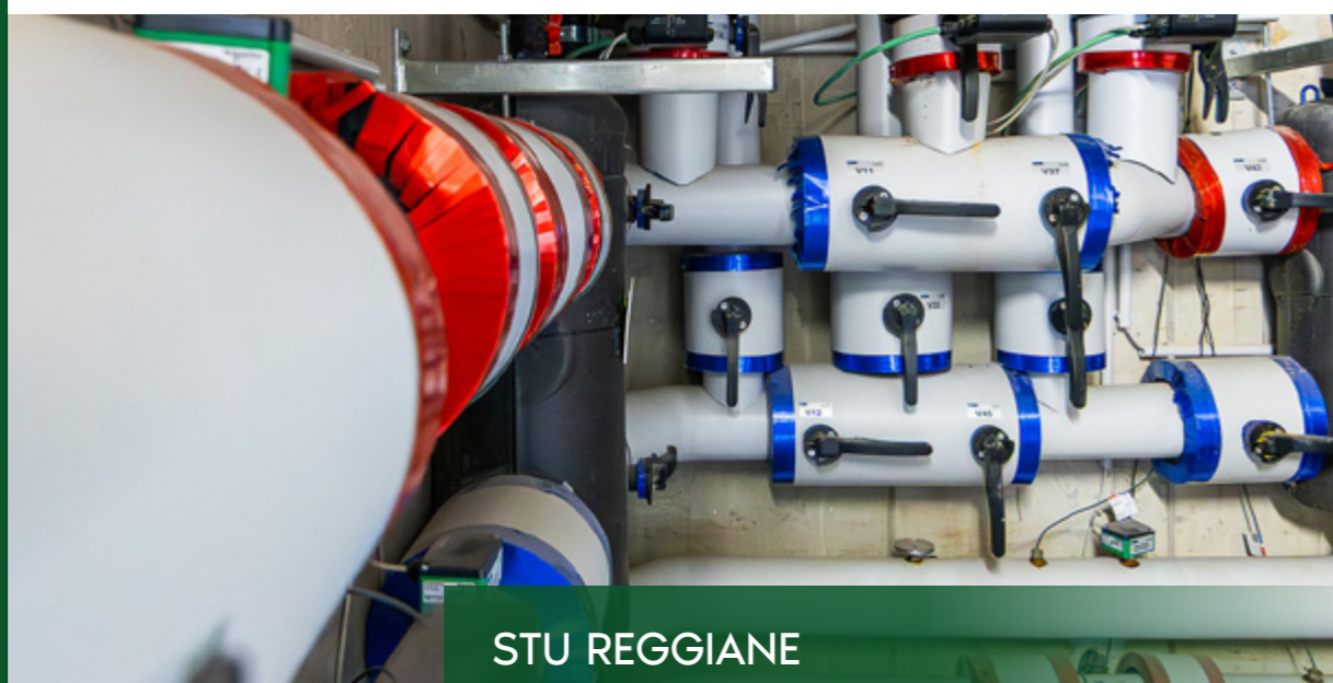
STU REGGIANE PADIGLIONE 15BC

Ogni intervento è orientato all'efficienza energetica e alla qualità, con particolare attenzione alla riqualificazione e all'innovazione tecnologica.