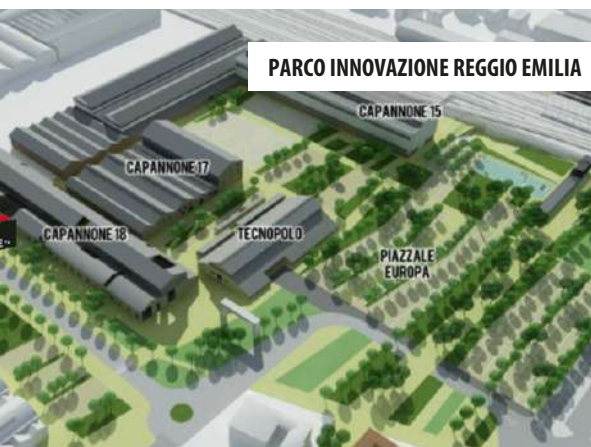
PARCO INNOVAZIONE REGGIO EMILIA

CARPIGIANI SPA Servizio di manutenzione programmata, straordinaria e a guasto per il mantenimento in efficienza di cabine di trasformazione MT/BT (periodo 2019-ad oggi)