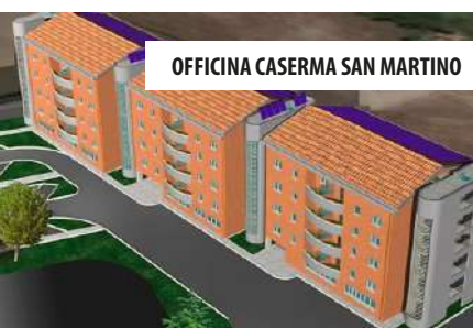
OFFICINA CASERMA SAN MARTINO