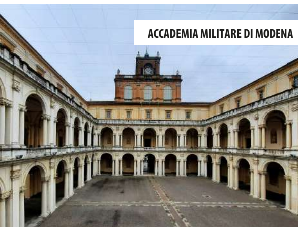
ACCADEMIA MILITARE DI MODENA

ACCADEMIA MILITARE DI MODENA Servizio di manutenzione programmata, straordinaria e a guasto per il mantenimento in efficienza di cabine di trasformazione MT/BT (periodo 2017-ad oggi)