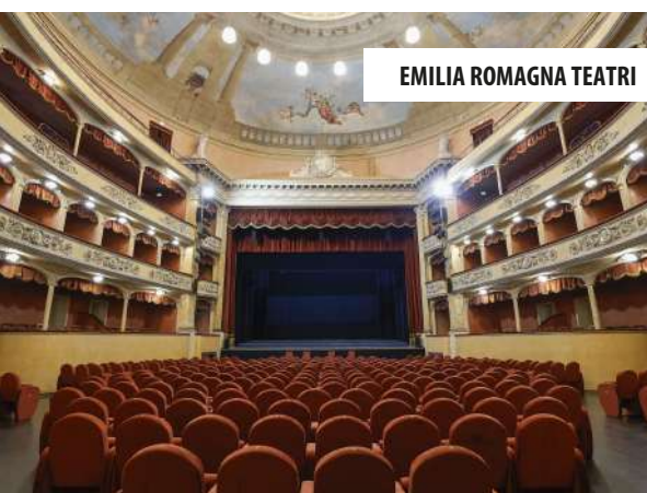
EMILIA ROMAGNA TEATRI

EMILIA ROMAGNA TEATRI Manutenzione ordinaria impianti elettrici teatri provincia di Modena (periodo 2016-ad oggi)