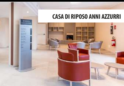
CASA DI RIPOSO ANNI AZZURRI