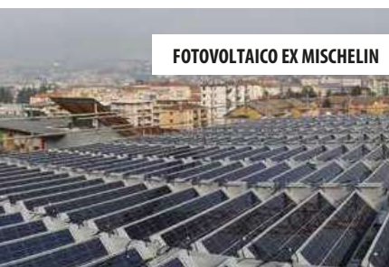
FOTOVOLTAICO EX MISCHLIN