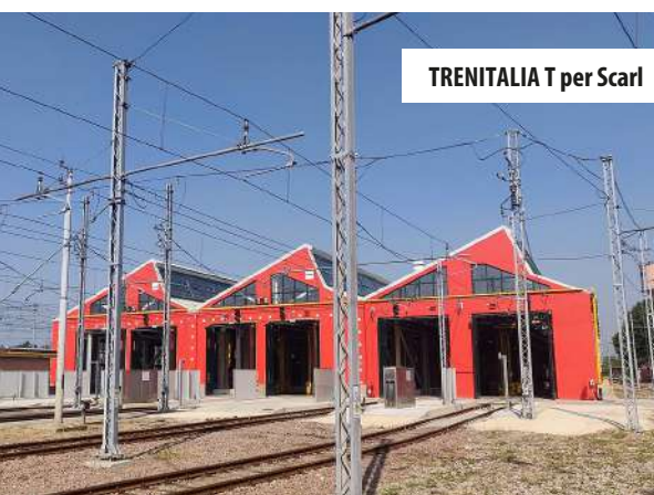
TRENITALIA T per Scarl

TRENITALIA T per Scarl Servizio di manutenzione programmata, straordinaria e a guasto per il mantenimento in efficienza degli impianti elettrici, delle cabine di Trasformazione MT/BT e impianti di terra di pertinenza di Trenitalia Tper Scarl (periodo 2022- oggi)