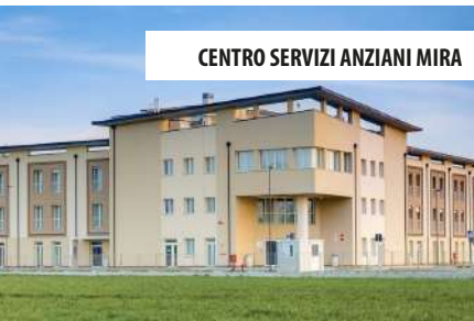
CENTRO SERVIZI ANZIANI MIRA